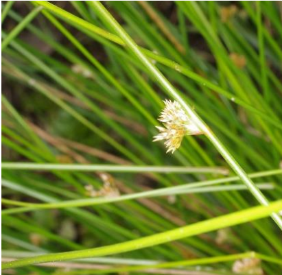
イ(イグサ、トウシンソウ)

水は必要ですが、たくさんはいりません。池のふちや浅い水たまりなど、しめった所が大好きです。