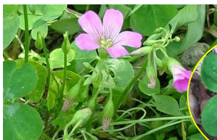
ムラサキカタバミ

庭や公園、学校の校庭にもたくさん生えています。 大きな3枚の葉で、赤紫色の花が咲きます。