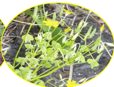
オッタチカタバミ

公園や道ばたにたくさん生えています。 葉が3枚で黄色の花が咲きます。赤い葉のカタバミもあります。クローバーの葉に似ていますが、葉はもっと小さいです。